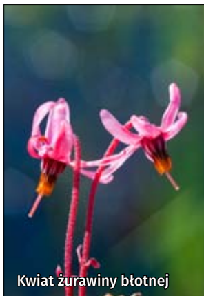
Kwiat żurawiny błotnej

Rezerwat Małoziemce – pow. 38 ha, przedmiotem ochrony są miejsca łąkowe czapli siwej i innych gatunków ptaków. Rezerwat jest częściowo udostępniony dzięki szlakowi turystycznemu „Trzech Jezior” i trasie rowerowej. Ze względu na charakter rezerwatu zaleca się umiarkowane jego wykorzystywanie w celach turystycznych. Rezerwat jest trudny do odnalezienia i zwiedzania.