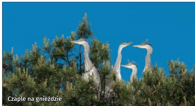
Czaple na gnieździe

Rezerwat Trzy Jeziora – pow. 749 ha. Rezerwat wodno-torfowiskowy, największy w Sobiborskim Parku Krajobrazowym.