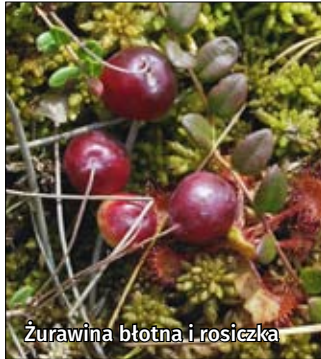
Żurawina błotna i rosiczka

Krowie Bagno wraz z zespołem wodno-torfowiskowym Bagno Laskie – jego fragmenty stanowią ostoję siedliskową programu Natura 2000. Ostoja obejmuje wschodnią część kompleksu Krowiego Bagna, z zanikającymi jeziorami eutroficznymi: Laskie, Krychowskie, Lubowierz, Lubowierzek. Na jeziorach otoczonych turzycą bagienną pływają grzybienie białe. W południowo-wschodnim narożniku Krowiego Bagna mieści się wieża z widokiem na grodzisko, osadę z wczesnego średniowiecza, położona na kredowej wyspie.